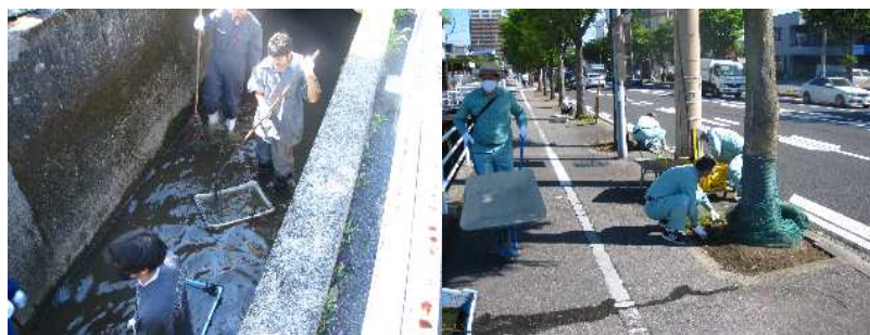
地域ボランティア清掃写真