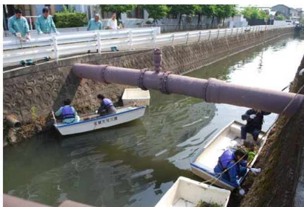
令和元年ボランティア清掃