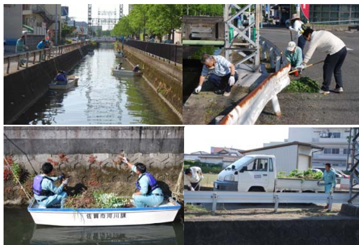
平成 30 年ボランティア清掃